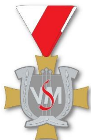
Verdienstkreuz in Silber

Obleute und Kapellmeister können bei mindestens 30-jähriger Tätigkeit das Verdienstkreuz in Silber und bei mindestens 40-jähriger Tätigkeit das Verdienstkreuz in Gold erhalten.