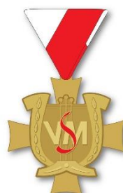
Verdienstkreuz in Gold

Sämtliche Verdienstkreuze werden ausnahmslos bei der Jahreshauptversammlung des Verbandes Südtiroler Musikkapellen verliehen. Anträge, welche am 10. April 2021 berücksichtigt werden sollen, sind innerhalb 28. Februar 2021 über das VSM-Office einzureichen.