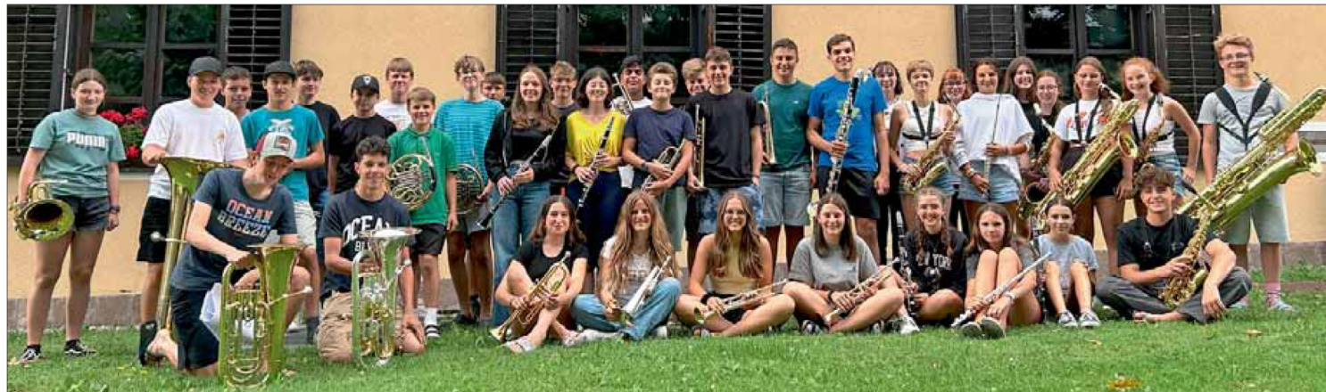
Viel Freude an der Musik: die 38 Jungmusikantinnen und Jungmusikanten im Alter von 12 bis 17 Jahren bei der Jungbläserwoche in Dietenheim ste

38 Jungmusikantinnen und Jungmusikanten im Alter von 12 bis 17 Jahren proben derzeit für das Abschlusskonzert am morgigen Samstag. Sie kommen aus ganz Südtirol, wobei das Pustertal am stärksten vertreten ist.